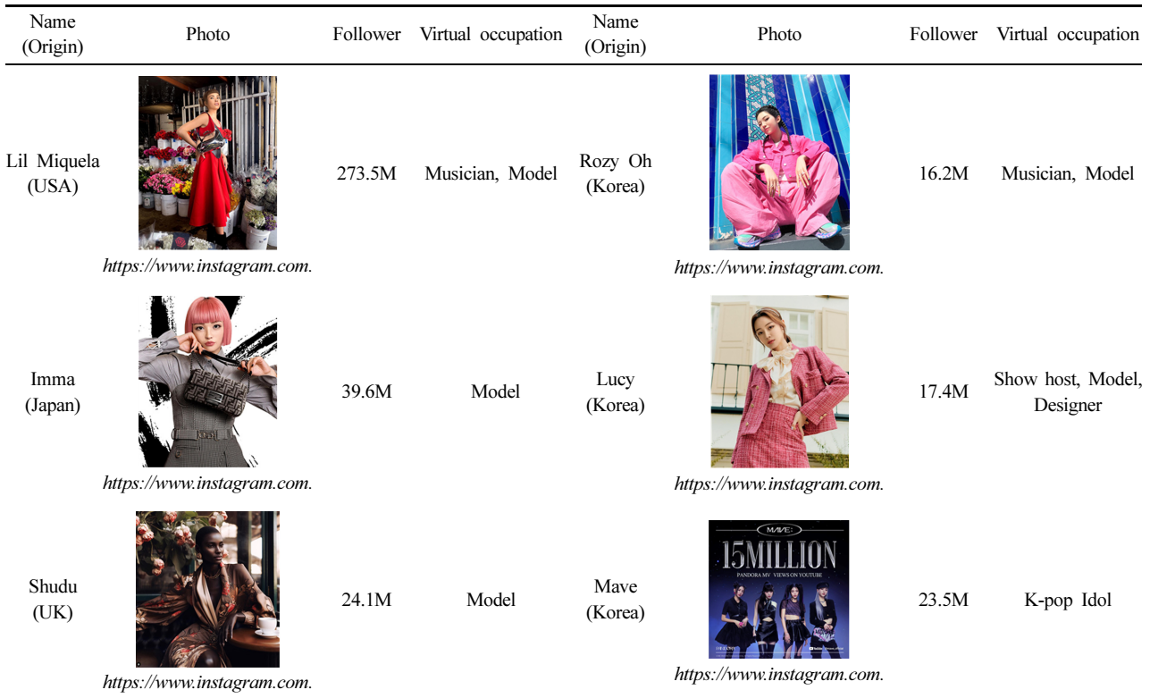
Table 1. Major virtual influencer in the world

Note: The follower count was measured as of October 27, 2023