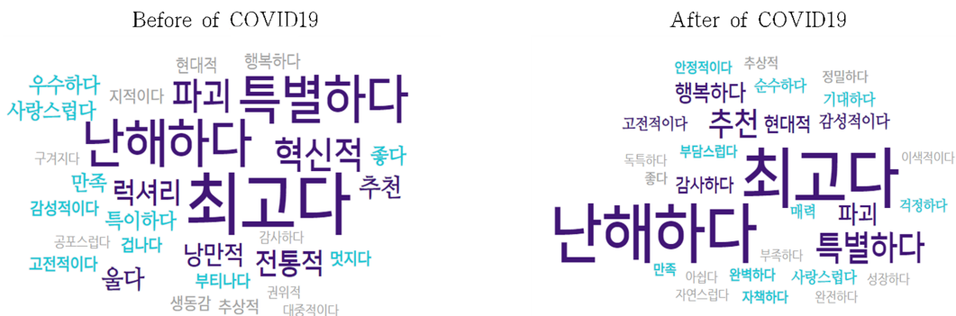
Fig. 4. Result of emotional analysis world cloud.