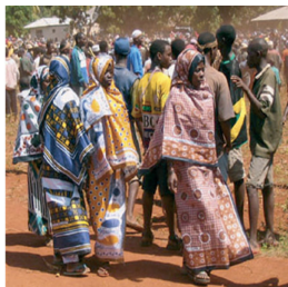
Fig. 12. Zanzibar women dressed in Kanga at a festival. Kangas - the voice of Zanzibar Women? (2006), p.1

호의적인 대변자 역할로써 강가는 정치적 캠페인이나 회사 광고 등에도 이용되고 있다(Ressler & Horst, 2019). 즉 특정 후보나 정치 단체를 지지하는 사람들의 정체성을 형성하기 위해 정치적 규합에도 강가를 사용한다(“Swahili proverbs”, n. d.). 그리고 어떤 정치적인 집단의 경우 같은 정당임을 나타내기 위해 자신들의 문화를 반영하여 창의적으로 제작한 강가를 보여 준다(Ressler & Horst, 2019; Ressler, 2012). Fig. 16은 2007-2008년 케냐 선거에서 정치적 폭동 후에 제작된 캐슈 모티프의 특별한 그린 색상의 강가이다. 캐슈는 미래의 희망, 변영, 그리고 평화를 표현하고자 한 것이었다(Ressler & Horst,