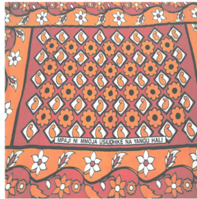
Fig. 7. Molly printed Kanga. https://tdsblog.com