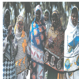
Fig. 14. Swahili women dressed in modern Kanga.