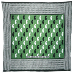
Fig. 16. A Special Green Kanga with the cashew symbol. The Kanga - An African Cloth (2019), p.45