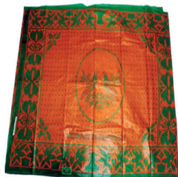
Fig. 9. Old Kanga with the proverb. Kangas - the voice of Zanzibar Women? (2006), p.12