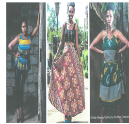
Fig. 23. Evolution into Contemporary designs(2019). https://www.dhw.com