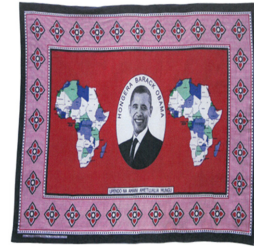
Fig. 19. Congratulations Barack Obama - Love and peace come from God, The Kanga - An African Cloth (2019), p.103

2019; Mutere, 2015). Fig. 17은 Julius Nyerere의 삶을 칭송하고 죽음을 애도하는 캅가이며 Fig. 18은 엘리자베스 여왕(the Queen Elizabeth)의 대관식을 위한 캅가를 착장한 모습이다. Fig. 19는 오바마(Barack Obama)대통령 취임을 축하하기 위한 캅가이다. 더욱이 캅가는 여러가지 발전적인 제도에 대한 인식을 이끌어내고 공공 건강캠페인 기간에 사람들의 마음을 움직이게 하는데 이용된다(“Swahili proverbs”, n. d.).