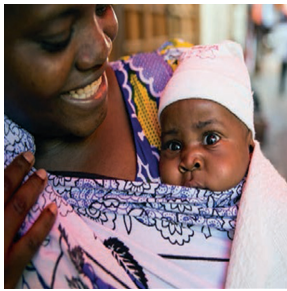
Fig. 6. A mother swaddles and carries her baby in her Kanga.