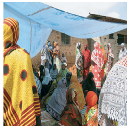
Fig. 13. A funeral where all women are wearing Kangas. Kangas - the voice of Zanzibar Women? (2006), p.18