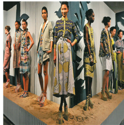
Fig. 21. Spring/Summer 2011 collection by Suno. Culture to Catwalk(2011), p.29