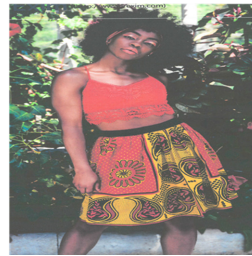
Fig. 22. Contemporary skirt with Kanga(2017). www.jrexim.com