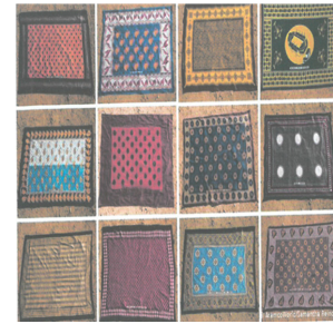
Fig. 8. The kinds of Kanga. https://www.dw.com

University Library., 2019). 캅가의 용도는 스커트, 두건, 에이프린, 킵받침, 수건, 커튼, 걸레, 테이블포, 수영복까지 이외도 다양하게 사용되고 있다. 즉 캅가는 놀라우리만치 유용하게 사용되는 스와힐리 문화의 전통의상으로 뿐만 아니라 취침이나, 가사 활동이나 아기를 감싸는 데까지 사용되고 있다(“The Kanga”, 2018; Msangi, 2021).