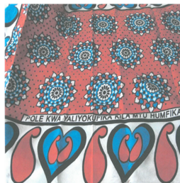
Fig. 10. Notice the polite notice. https://tdsblog.com