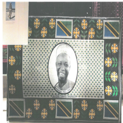
Fig. 17. A Kanga' Commemorating the life and mourning the death of Julius Nyerere. www.jrexim.com