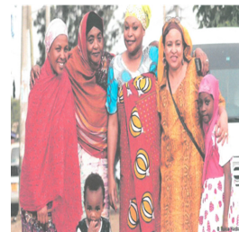
Fig. 15. Mobilizes people in East Africa. https://www.dw.com