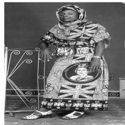
Fig. 18. Queen Elizabeth II and Union Flags Printed Kanga. Reprinted from Gott et al(2017), http://direct.mit.edu/afar/article , p.50