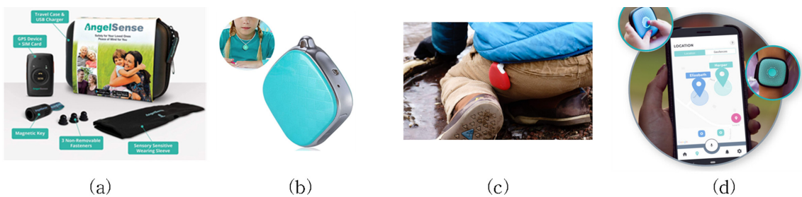
Fig. 4. Attachment methods of GPS tracker for kids; (a) accessories-pin/pocket, G1, https://www.angelsense.com/ (b) accessories-necklace, G2, https://www.amazon.com (c) accessories-clip, G3, https://www.jiobit.com (d) accessories-ring/band, G4, https://relaypro.com .