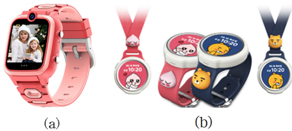
Fig. 5. Attachment methods of smart watch for kids; (a) accessories/ band, W1, https://www.amazon.com , (b) accessories-band/necklace, W7, https://shop.uplus.co.kr/