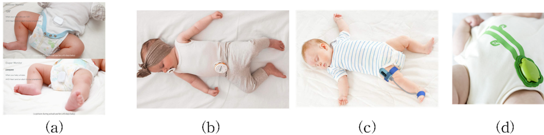
Fig. 2. Attachment methods of wearable monitor; (a) accessories, up: clip, down: velcro, M1, www.akois.net , (b) accessories-clip, M3, https://www.mylevana.com , (c) accessories-band, M8, https://getwellue.com , (d) clothes, M13, https://www.amazon.com .