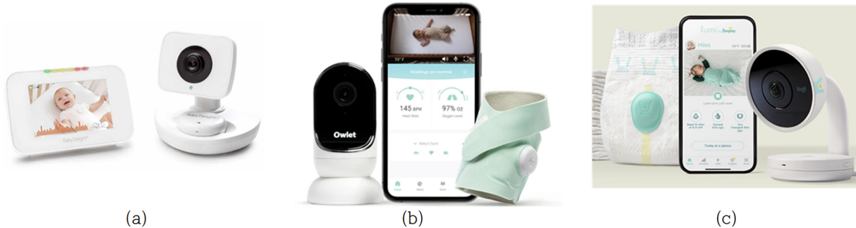
Fig. 1. Devices that combine wearable monitors and video; (a) M2, https://babydelight.com , (b) M14, https://owletcare.com (c) M17, https://www.lumibypampers.com

위치추적기에 대한 대금을 선불로 지불하는 것 외에도 전화망 사용에 대한 매월 서비스 요금을 별도 지급하고 있었다.