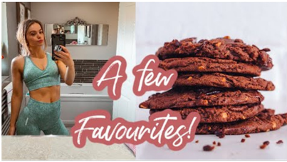
Fig. 12. A few favourites I'm loving during lockdown(NaturallyStefanie, 2020).