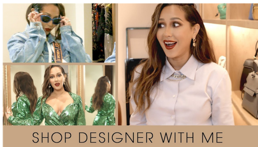
Fig. 8. Shop with me head-to-toe luxury consignment(All Things Adrienne, 2019).

패션 일상 유형 콘텐츠들은 일상, 패션, 식생활, 뷰티, 생필품 등 다양한 생활 영역에서의 비거니즘의 실천에 대한 콘텐츠로 구성되어 있었다. 일부 유튜버들은 자신이 쇼핑하는 모습을 촬영하면서, 제품을 입어보고, 고민하며, 고르는 과정을 공유하였다(Fig. 8). 다른 유튜버는 화장을 하거나 옷을 고르는 등 일상의 모습을 먼저 촬영한 후에 보이소머를 녹음하여 화면에서 벌어지고 있는 상황을 설명하기도 하고, 촬영 중 자신의 행동에 대해 그 순간 떠오르는 생각들을 친근한 말투로 설명하기도 하였다(Fig. 9). 더불어, 패션 일상의 콘텐츠는 주로 유튜버의 집이나 방, 자동차나 대중교통 안 등 일상생활이 이