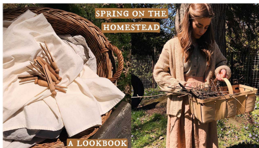
Fig. 15. Spring on the homestead - A lookbook(Girl in calico, 2020).

이 유형 속의 비건 유튜버들은 편안한 말투를 사용하거나 재미있는 멘트나 편집 효과 등을 통해서 관련 정보를 지루하지