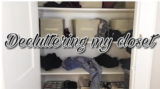
Fig. 11. Closet makeover Clean with me(Kyra Ann, 2018).

루어지는 공간에서 주로 촬영되었는데, 이를 보는 시청자들은 친숙한 환경으로 인해 유튜브와의 공감이나 유대감을 느끼고 있었다(Fig. 10). 또한, 일부 유튜버들은 시청자들이 자신과 비슷한 연령대이며 유사한 관심사를 가지고 있음을 인지하고서, 이를 자주 언급하기도 하였다. 일부 유튜버들은 친한 친구와 시간을 보내며 대화를 나누는 것과 같은 말투로 옷장 정리를 하는 모습을 촬영하였는데, 자신의 옷장에 있는 옷들을 버릴지 계속 착용할지를 고민하면서 마치 친구와 의논하듯이 시청자들에게 댓글로 의견을 남겨달라고 하였다(Fig. 11). 이들은 본인과 비슷한 눈높이에 설치된 카메라 앵글로 구독자들과 공감대 및 유대를 형성하면서 참여 요소와 재미 요소를 구현하고 있었다. 이는 시청자들로 하여금 영상 제작자 옆에서 대화를 나누는 것처럼 느껴지도록 하는 효과가 있었는데, 이러한 친근감의 유도는 있는 그대로의 모습을 보여줌으로써 시청자들의 공감과 소통을 끌어냈다. 댓글의 반응을 살펴보면, 시청자들은 영상 제작자가 시청자들이 바로 옆에 있는 것처럼 말하거나 행동할 때 친근감과 재미를 느끼고 있었다. 아울러, 유튜버 자신이 댓글에 직접 답글을 달거나 '좋아요'를 누르고, 영상 내에서 과거 자신의 영상에 달렸던 댓글에 대해 언급을 하는 등 시청자와의 활발한 소통도 하고 있었는데, 이러한 활발한 상호작용을 통해서 시청자는 스스로 자신만의 비거니즘에 대한 지식을 구성하게 되고, 기존에 비거니즘을 실천하지 않거나 평소 비건 패션에 관심이 낮은 시청자들도 비거니즘과 접근성이 좋아지고 있었다.