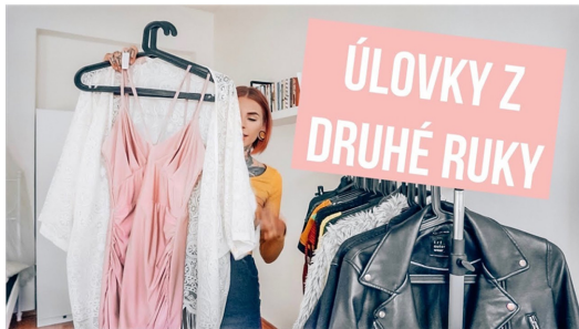
Fig. 6. Secondhand haul(Dewii, 2019).