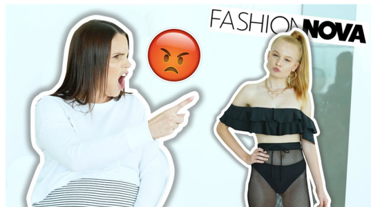
Fig. 18. Mum reacts to my fashion nova bikinis(Mia's Life, 2019).