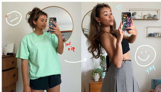
Fig. 17. I let my followers transform my wardrobe(Ur mom ashley, 2020).

유튜브 내 비건 패션 콘텐츠에 나타나는 비거니즘 메시지의 또 다른 특성은 비건 패션의 미적 표현과 상호작용이 강조된다는 점이었다. 비건 유튜버들은 비건 패션을 시각화하는 데 비거니즘 자체보다는 패션 스타일에 더욱 초점을 맞추는 경향을 보였는데, 가령, ‘계절에 맞는 룩북’, ‘새로운 스타일 도전’ 등에서 보듯이 스타일과 개성표현의 관점에서 미적 감각을 충족시킬 수 있는 내용을 콘텐츠로 제작하는 것으로 나타났다. 즉, 패션 콘텐츠의 제작에 있어서, 브랜드나 제품 등 비거니즘 실천에 유용한 정보들을 단순히 전달함을 넘어서서 자신의 취향과 개성을 표출하며 실험하는 도구로 사용하고 있었다. 그들은 자신의 개성을 비건 패션 제품과 연결 지어 감각적인 영상으로 제작하거나, 실험적인 패션 스타일을 연출한 후 이를 타인에게 보여주고 반응을 유도하는 콘텐츠로 표현을 하였는데, 이러한