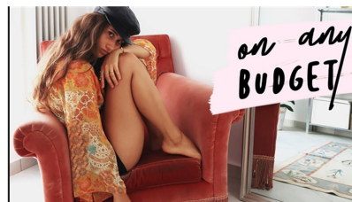
Fig. 2. How To Shop Sustainably & Quit Fast Fashion!(Kristen Leo, 2018).