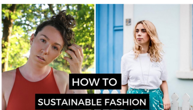
Fig. 1. How to shop ethical sustainable fashion (Sustainably Vegan, 2018).

이 유형에 나타나는 비거니즘 요인은 중고 구입이라는 특징으로 정리할 수 있다. 새 패션 제품 하울과는 달리, 중고 패션 제품 하울은 시청자가 영상에 나오는 것과 동일한 제품을 구입할 수가 없기에 기존의 패션 하울 영상과는 차이점이 있다. 새로운 패션 제품의 구입보다는 중고 제품의 구입과 사용의 장력에 대한 메시지를 전달하는 이러한 비거니즘의 특징은 선행연