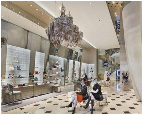
Fig. 12. Seoul, Dior Lee Bul work. https://www.naver.com .

단순히 예술가들과의 콜라보레이션을 통해 제품에 예술을 차용해 오는 것이 아니라, 제품으로서의 기능을 거의 배제시켜 예술 작품으로서 제시하는 방식이다. 이를 통해 협업에 사용된 본래의 제품은 예술가들의 명성과 더불어 마치 예술가들의 영감의 원천과 같은 아우라를 갖게 되었다. 패션 제품의 기능성을 최대한 배제시키고 예술 작품이 갖고 있는 유일성, 원본성 등의 특성을 활용하여 아무나 자신들과 같아질 수 없다는 배타성을 더욱 부여하고 있었다.