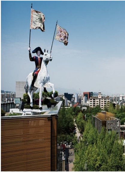
Fig. 7. Seoul, Hermès.