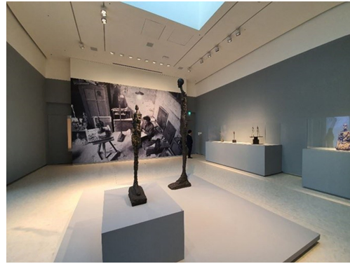
Fig. 16. Seoul, Louis Vuitton. Alberto Giacometti exhibition. https://www.google.co.kr

탕으로 다양한 예술 사업을 이어나가고 있다. 그 중에서 2014년 세계적인 건축가인 프랭크 게리(Frank Gehry)에 의해 디자인된 루이비통 재단 뮤지엄은 프랑스 파리의 새로운 랜드마크 자리 잡았다. 해당 뮤지엄에서는 재단 뮤지엄의 소장품과 LVMH 그룹의 회장 베르나르 아르노(Bernard Arnault)의 개인 소장품을 전시하고 있으며, 현대 예술가들의 후원을 통해 현대 예술을 장려하고 촉진시키기 위해 노력하고 있다.