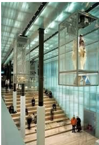
Fig. 17. New York, Prada. Cage display. http://www.waterandnature.org .

프라다의 뉴욕 에피센터는 구겐하임 미술관 분관의 자리에 세계적인 건축가 램 쿨하스의 인테리어를 통해 새롭게 오픈되었다. 내부는 넓고 길쭉한 곡선의 바다, 공중에 매달린 케이지, 유리 엘리베이터 등 다양한 장치들로 구성되어 있다. 그 중에서 천장에 매달려 있는 Fig. 17의 케이지는 교회 내 성도들의 종교적 유물을 상징하고 있다고 보기도 한다(Lipovetsky & Manlow, 2004). 자연스럽게 소비자들의 시선이 위를 향하게 되며 마치 제품을 우러러보는 듯한 자세를 취하게 되며, 가까이 다가갈 수 없는 거리감을 통해 소비자들은 해당 제품에 경외심을 느끼기 때문이다. 더불어 패션 제품의 특성상 가까이서 제