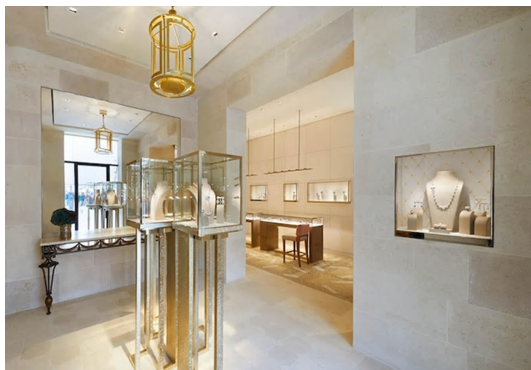
Fig. 1. Paris, Louis Vuitton display. https://kr.louisvuitton.com .

박물관의 디스플레이를 활용하는 방식은 제품을 마치 ‘문화유산’과 같이 제공함으로써 가치 있는 소비 경험을 하도록 도와주어 소비자들이 제품이 마치 보존할만한 가치가 있는 예술