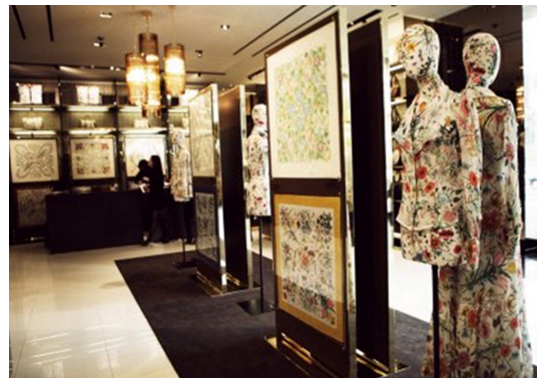
Fig. 6. Seoul, Gucci Flora archive exhibition. https://cm.asia.co.kr .