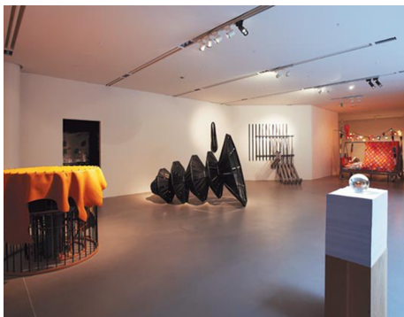
Fig. 15. Seoul, Hermès Condensation exhibition. https://www.google.co.kr