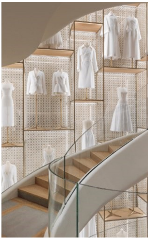
Fig. 5. Paris, Dior. https://senatus.net .

력을 경험할 수 있도록 하였다. 이와 같은 구성을 통해 소비자들의 흥미를 이끌어 내며 소비자들 스스로 샤넬의 공방에 대해 더욱 관심을 갖도록 하였다. 더불어 장인들의 기술력을 직접적으로 경험하며 그들의 기술에 존경심을 갖고 그들만의 차별화된 기술력이 보존할 만한 가치가 있음을 각인시켰다.