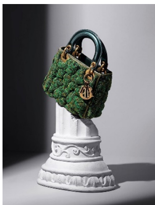
Fig. 13. Seoul, Dior. Dior Lady Art. https://www.noblesse.com .

루이비통은 쿠사마 야요이(Kusama Yayoi)와의 콜라보레이션 당시 뉴욕 플래그십 스토어 전체를 쿠사마 야요이의 상징이라고 할 수 있는 폴카 도트 무늬로 뒤덮고 쇼윈도를 마치 설치 미술 작품을 전시해 놓은 것처럼 디스플레이 하였다. 쇼윈도는 브랜