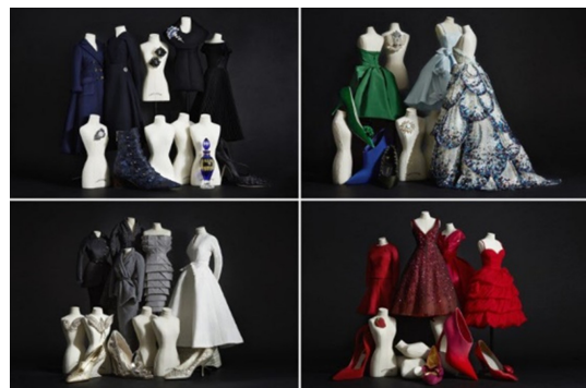
Fig. 9. Seoul, Dior. Dior Colors exhibition. https://www.naver.com

홍콩에 위치한 샤넬 플래그십 스토어는 혁신적인 시도들로 패션계에서 위대한 디자이너로 자리매김한 가브리엘 샤넬의 생애와 철학 등을 보여주고 있었다. 플래그십 스토어 자체가 가브리엘 샤넬이 살았던 파리 캉봉가에 위치한 아파트의 절충주