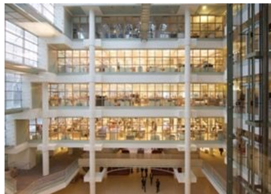
Fig. 3. Pantin, Hermès. https://lemag.seinesaintdenis.fr .

1983년 칼 라거펠트(Karl Lagerfeld)가 샤넬에 영입되면서부터 협업을 이어온 오랜 역사를 가진 르사주 공방에 대한 전시는 공방에서 사용하는 도구들과, 장인들이 제작한 샘플과 컬렉션들로 구성되었다. 사진, 필름, 텍스트, 샘플 등을 활용하여 실제 르사주 공방을 경험하는 것과 같은 전시를 통해 소비자들은 르사주 공방에 대해 더욱 자세히 접할 수 있게 하였다. 또한 르사주 공방의 장인들과 함께 직접 대형 지수 장식품을 제작할 수 있는 체험을 통해 소비자들이 직접 장인들의 노하우와 기술