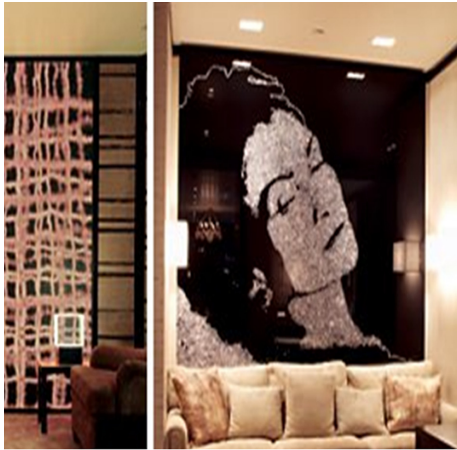
Fig. 10. Hong Kong, Chanel Vik Muniz-Chanel portrait. http://design.designhouse.co.kr

의에 영감을 받아 디자인되었다고 밝히며, 플래그십 스토어 내부에 5명의 예술가들에 의해 당시 샤넬이 애정을 가졌던 다섯 가지의 오브제(진주 목걸이, 다이아몬드, 트위드 패브릭, 신화적 동물 장식품, 카멜리아 꽃)들이 현대적으로 재해석되어 전시되고 있었다. 비크 무니스(Vik Muniz)는 Fig. 10과 같이 다이아몬드 디스트를 사용하여 가브리엘 샤넬의 초상화를 제작하였고, 장 미셸 오토니엘(Jean-Michel Othoniel)은 샤넬이 가장 사랑했다고 알려진 진주 목걸이를 재해석하여 마치 진주 커튼과 같은 작품을 제작하여 매장 천장에서부터 흘러내리는 것과 같이 전시해 놓았다. 플래그십 스토어 전체에 샤넬의 철학이 담긴 오브제를 오마주한 것과 같은 예술 작품들을 구성시키며 소비자들이 자연스럽게 창립자인 샤넬을 해당 예술 작품의 근간과(Kapferer & Bastein, 2010) 같이 느끼게 하였다.