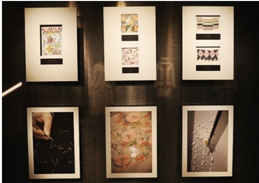
Fig. 4. Seoul, Chanel. Lesage exhibition. https://www.naver.com .