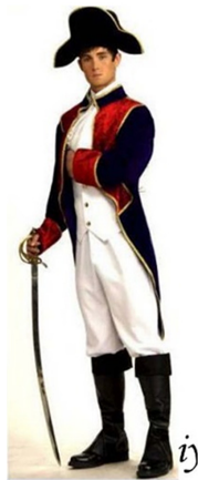
Fig. 8. 19th century French uniform. http://www.ijdo.co.kr

드의 아이덴티티와 가치를 더욱 확고하게 확립시켜주며, 예술화를 통해 만들어진 브랜드의 역사에 관한 스토리는 소비자들 스스로 브랜드를 지속적으로 상기시키도록 한다. 나아가 이를 통해 브랜드의 역사와 전통을 인정받고 브랜드 혹은 제품에 부여하려 하는 영속성에 신뢰를 더한다. 그들의 헤리티지를 예술화하여 보여줌으로써 현재 부각되고 있는 브랜드의 상업적인 면을 상쇄시켜(Kapferer & Bastien, 2010), 브랜드와 제품이 영속성을 부여받는 것에 정당성을 제시한다.