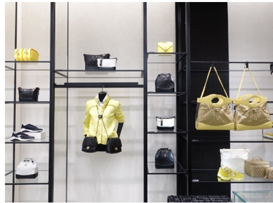
Fig. 2. Seoul, Chanel display. https://www.naver.com .

성을 가진 작품과 같다고 생각하게 한다. 더불어 제품을 귀한 작품을 다루는 것과 같이 행동하는 판매원들의 모습 또한 소비자들이 그 제품은 틀림없이 귀한 것이며 마땅히 존중해야 한다는 느낌을 갖게 한다(Mikunda, 2004/2006). 소비자들 모두 해당 제품이 당연히 판매를 위한 사치품이며, 시군성을 갖고 있는 상품임을 인지하고 있지만, 박물관에서 큐레이터나 보존처리사가 예술작품이나 유물을 다루는 태도를 취하는 방식들을 통해 플래그십 스토어 내 제품들은 오래 보존해야만 하는 예술성을 지닌 문화적 가치가 있는 예술 작품과 같은 지위를 부여받는다.