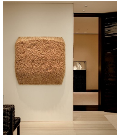
Fig. 11. Seoul, Chanel Paola Pivi-Untitled. https://www.naver.com .

서울 청담동의 하우스 오브 디올 매장에는 Fig. 12에서 보이는 것과 같이 한국 아티스트 이불의 작품이 매장의 중심부에 걸려 있어 소비자들은 매장에 들어서자마자 예술 작품과 제품을 동일 선상에서 바라보게 된다. 이불 작품의 설치의 지금까