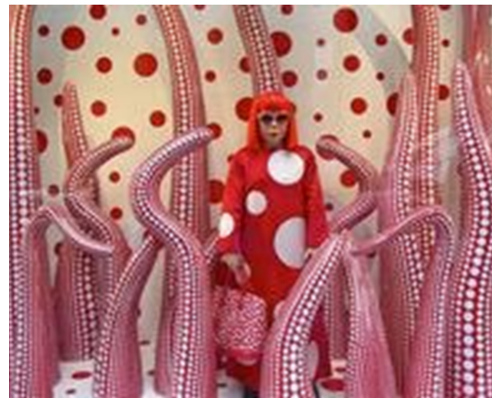
Fig. 14. New York, Louis Vuitton Collaboration with Kusama Yayoi. http://www.daum.net .

드의 환상과 꿈을 함축적으로 제공해 주는 공간이다. 쇼윈도를 통해 소비자들은 브랜드가 제공하는 판타지와 현실세계인 거리 사이에서 제품에 대한 숙고의 시간을 갖게 된다(Crewe, 2015). 이를 위해서는 일반적으로 쇼윈도에서 브랜드의 예술성도 나타내야 하지만 예술성은 제품을 더욱 부각시키기 위한 바탕으로 사용되어야 한다. 그러나 Fig. 14과 같이 당시 루이비통의 쇼윈도에는 제품은 잘 보이지 않고, 쿠사마 야요이 형상의 마네킹과 그 주변을 가득 매운 그녀의 작품에 더욱 눈이 가도록 디스플레이 되어 있었다. 쇼윈도에 예술성을 더욱 부각시켜 제품을 거의 드러내지 않으므로써 그들의 상업적 느낌을 상쇄시키며, 소비자들로 하여금 플래그십 스토어 내부까지 쿠사마 야요이의 아우라가 이어질 것만 같은 예술적 환상을 갖도록 하였다.