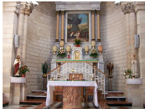
Fig. 18. Altar. http://www.ohmynews.com .

예술은 오랜 시간 동안 종교와 지배계급의 보호아래 대중들과의 거리를 유지함으로써 제의와 숭배의 대상으로서 권위를 인정받았다. 따라서 그 대상에 ‘가까이 다가선다는 것’, ‘쉽게 마주 할 수 있다는 것’ 자체가 이미 상당한 지위를 갖고 있음을 의미한다(Choi, 2018). 이처럼 플래그십 스토어를 일반인은 쉽게 범접할 수 없다는 종교적 의미를 갖는 장치들을 통해 신