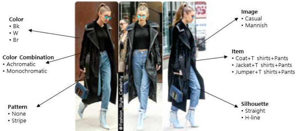
Fig. 8. Gigi Hadid. http://www.instagram.com