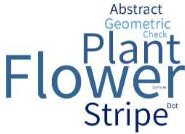
Fig. 6. Pattern of influencer fashion.