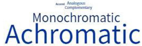
Fig. 4. Color combination of influencer fashion.