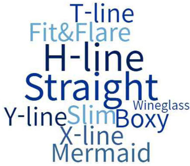
Fig. 2. Silhouette of influencer fashion.