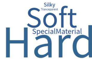
Fig. 5. Material of influencer fashion.