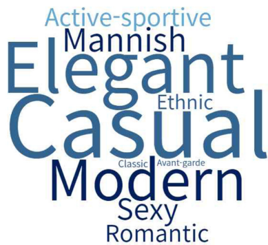
Fig. 7. Image of influencer fashion.