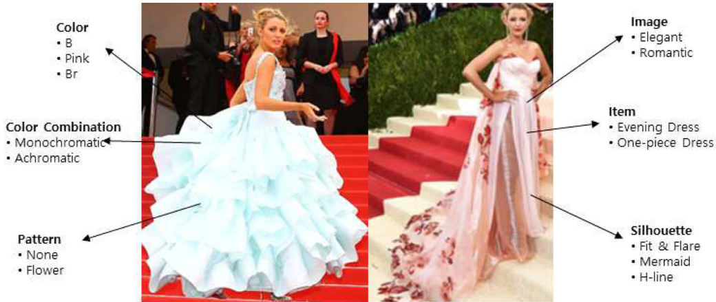
Fig. 10. Blake Lively.

루언서에 비해 여성스러운 패션스타일을 즐겨 입는 것으로 나타났다. 이러한 디자인 특성을 바탕으로 Blake Lively의 이미지는 엘레гант 이미지(9.7%)가 가장 많이 나타났으며, 다음으로 로맨틱 이미지(2.1%)가 나타났다. 그 외에 Kendall Jenner의 패션스타일에서 나타난 이미지는 에스닉과 섹시 이미지(0.7%)이다.