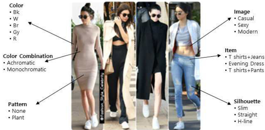
Fig. 9. Kendall Jenner. http://www.instagram.com

(9.7%)가 가장 많이 나타났으며, 다음으로 W(6.3%), Br(5.6%), Gy(4.9%), R(4.2%), YR(20.1%)가 나타났다. 따라서 Kendall Jenner는 무채색을 중심으로 브라운 계열이나 빨강색과 주황색을 즐겨 입는 것을 알 수 있다. 색채조화는 무채색조화(24.8%), 동일색상조화(5.5%), 강조색조화(2.8%) 등이 나타나 Kendall Jenner는 무채색을 중심으로 동일색상의 톤온톤 배색으로 즐겨 입는 것을 알 수 있다. 무늬는 민무늬(26.2%)가 가장 많았으며, 다음으로 식물무늬(2.8%), 스트라이프(1.4%) 등이 나타나 무늬가 없는 옷을 즐겨 입는 것으로 나타났다. 이러한 디자인 특성을 바탕으로 Kendall Jenner의 이미지는 캐주얼 이미지(9.9%)가 가장 많이 나타났으며, 다음으로 섹시 이미지(6.9%)가 나타났다. 그 외에 Kendall Jenner의 패션스타일에서 나타난 이미지는 모던(5.5%), 엘레전트와 매니시(4.1%), 액티브스포티브(2.8%) 이미지 등이다.