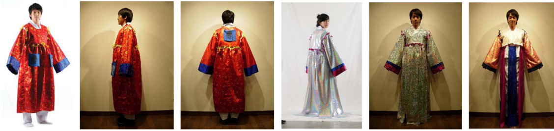
Fig. 3. Examples of the detachable festival costumes (September 25, 2010).