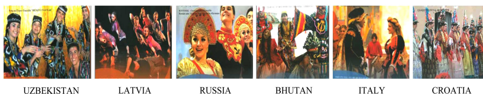
Fig. 2. Examples of festival costumes of foreign performance teams. Andong maskdance festival (2012), pp. 32-46.