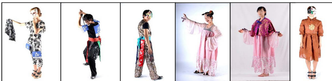
Fig. 11. The festival costumes for the local companies (August 25, 2012).