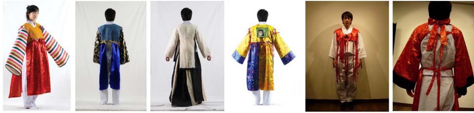
Fig. 6. Eco friendly usage of the detachable festival costumes (September 25, 2010).

을 착탈식으로 골라 붙여 ‘안동국제탈춤페스티벌’의 홍보효과를 극대화할 수 있다. 여덟째, 착탈식조립의상은 끈으로 사이즈를 조절하여 착용할 수 있으므로 그 특징을 활용하면 착용자의 의복사이즈 조절에 의한 의복적합성을 추구할 수 있다. 아홉째, 소매만 따로 착용한다거나 스커트 부분을 상의의 망토형식으로 활용한다거나 착용자의 취향과 창의성에 따라 전혀 새로운 용도로 변경함으로써 축제의상으로서의 활용도를 높일 수 있으며 다양한 연출방법에 따라 축제장의 방문객에게 시각적인 볼거리를 제공하는 효과가 있다(Fig. 5).