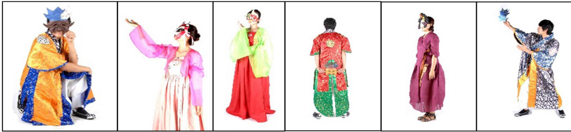
Fig. 12. The festival costumes for the spectator (August 25, 2012).

12). 축제의상 디자인 개발 및 상품화에 대한 타당성 분석에는 본 연구와 관련이 깊은 업무에 종사하고 있는 시민 55명이 자문단으로 참여하였다. 방문객을 위한 디자인의 특징은 착용자가 불특정 다수에 해당되므로 의복사이즈와 재료의 경제성에 관한 의견이 많았으며, 한복스타일을 선호하는 경향을 보였다. 전체적인 디자인 방향은 다음과 같다. 즉, 첫째, 지역민의 힘으로 만들어 세계인을 감동시키는 축제, 둘째, 지역민이 함께 즐거운 가치를 만드는 축제, 셋째, 지역의 문화인력이 창조하는 가능성을 제시하는 축제, 넷째, 관객이 직접 참여하는 능동적인 축제, 다섯째, 가족단위의 화합적 축제, 여섯째, 청년의 생명력과 노년의 원숙미가 공존하는 축제이다.