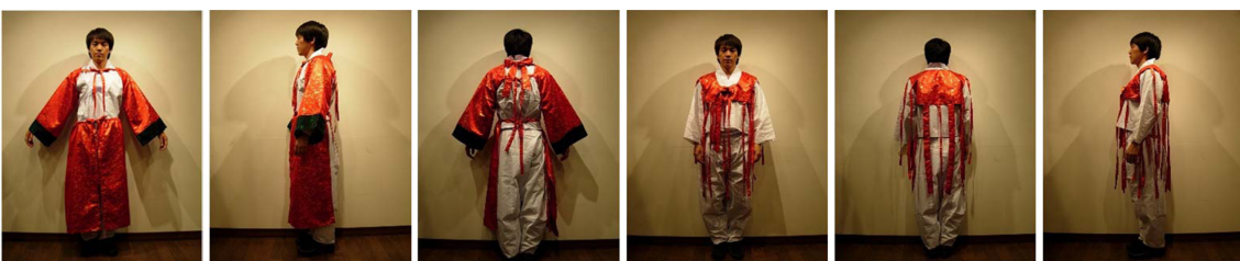
Fig. 5. Usage of the detachable festival costumes (September 25, 2010).

첫째, 본 디자인은 탈부착이 가능한 한복스타일의 축제의상 으로서 Fig. 3에서 보는 바와 같이 몸통부분, 양쪽 소매, 앞쪽 의 좌우, 뒤쪽의 좌우, 앞주머니가 각각 분리가능하며, 끈을 묶 어 서로 연결할 수 있다. 둘째, Fig. 4에서 보는 바와 같이, 취 향에 따라 다른 모양의 소매와 앞뒤쪽의 좌우를 서로 교체하여 연출할 수도 있고, 그 밖의 부분도 각각 다양하게 연출할 수 있다. 셋째, Fig. 5에서 보는 바와 같이, 양쪽 소매끼리만 연결하 면 탈춤과 같은 공연에서 팔동작을 요구하는 춤사위를 강조할 수 있음과 동시에 독특한 축제패션스타일을 형성할 수 있다. 넷 째, 소매, 앞쪽의 좌우, 뒤쪽, 목둘레(칼라) 부분을 착탈식으로 각각 따로 설계하여 소비자가 필요로 하는 조각만 선택하여 각 자의 기호에 따라 조립하여 착용할 수 있다. 다섯째, 커플끼리, 혹은 가족끼리 다른 색상이나 다른 소재를 결합하여 착용하면 가족과의 연대감과 함께 다양화 효과를 누릴 수 있다. 여섯째, 착탈 부분의 끈을 묶는 방법에 따라 연출효과가 다르다. 예를 들어, 느슨하게 묶으면 속옷이 드러나 보이는 효과와 함께 시원함을 느낄 수 있다. 일곱째, 포켓과 등 부분에 하회탈 그림