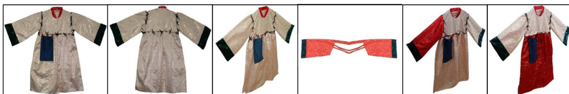
Fig. 9. Design registered with No. 30-0541138(2009) of the detachable festival costumes. http://kdj.kipris.or.kr

a, b, c, e, f : The Yi nationality's costumes and ornaments of China (2006), pp. 30-139. d : Research in ancient Chinese costume and its adornment (2001), p. 35.