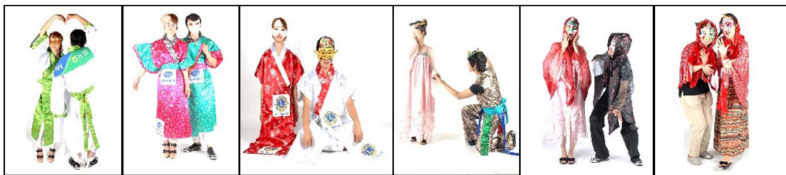
Fig. 10. The festival costumes for the local companies (August 25, 2012).

축제전문가가 제시한 지역축제 ‘안동국제탈춤페스티벌’의 특징과 조건은 지역민이 직접 창조하는 축제이므로 관람객을 위한 축제의상 디자인이 다음과 같은 방향으로 개발되었다(Fig.