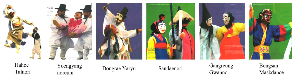
Fig. 1. Examples of festival costumes of Korean performance teams. Andong maskdance festival (2012), pp. 56-77.

둘째, 지역 전통문화자원과 관련된 지역축제의 연구현황과 자료조사를 통하여 의의를 분석하고, 나아가 지역의 ‘대표 축제’인 ‘안동국제탈춤페스티벌’의 현황과 의의를 분석하였다. 지