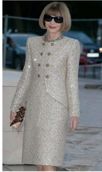
Fig. 11. Slim silhouette suits.