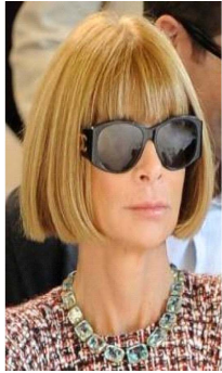
Fig. 36. The Erdem show during London Fashion Week S/S 2010.