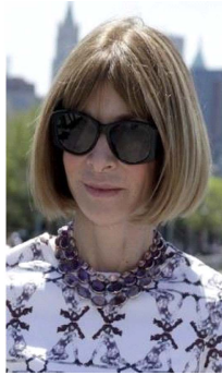
Fig. 37. The born free mother's day carnival 2014.