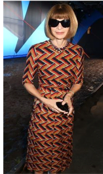
Fig. 28. Zigzag patterned dress.