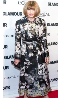
Fig. 29. Flower pattern silky trench coat.