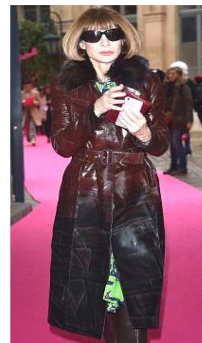
Fig. 33. Patchwork effect leather coat.