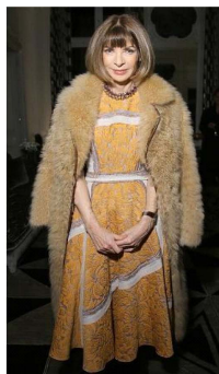
Fig. 18. Strong yellow dress with beige fur coat.