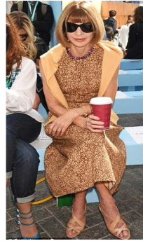
Fig. 39. Skin tone slink back high heel by Manolo Blanic.