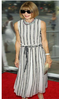
Fig. 27. Stripe effect detailed dress.