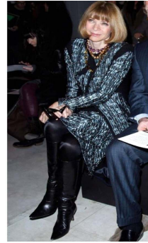
Fig. 40. Simple knee length black boots.

걸이는 주로 굵은 보석이 셋팅된 라운드 형태로 짧게 목을 감싸는 디자인을 착용하는데, 의상의 디테일이나 컬러에 따라 보석의 색이나 크기, 줄의 수 등 디테일이 변화함을 알 수 있었다.