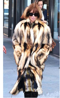
Fig. 15. Oversize silhouette coat celine 2012. www.gettyimages.com

글래스 실루엣을 선보였다. 또한 형태감 있는 아우터의 활용을 통해 스트레이트 실루엣, 오버사이즈 실루엣을 강조하거나 절충된 실루엣을 활용하기도 하는 등 다양한 착장을 통해 실루엣에 변화를 주고 있었다.