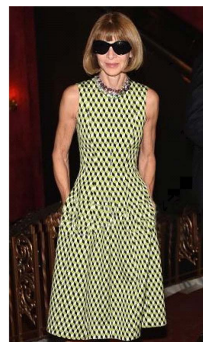
Fig. 19. Strong yellow green dress. www.ammy.com