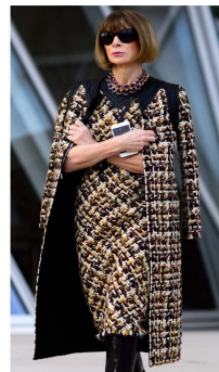
Fig. 32. Tweed long jacket with same fabric dress.