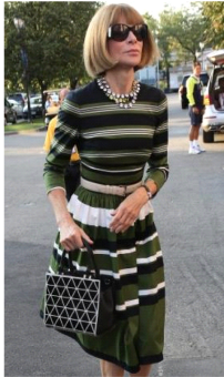
Fig. 26. Stripe pattern dress.