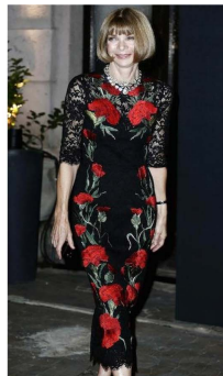
Fig. 7. Slim silhouette dress. Dolce & Gabbana 2015.