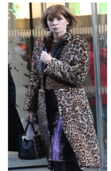
Fig. 35. Leopard pattern fur coat.

동시에, 밑단을 향할수록 짙게 그라데이션 되는 컬러를 연출하여 세련된 느낌을 주고 있다. 또, 카라 부분에만 모피를 적용하여 한층 외일드한 느낌을 강조하고 있다. Fig. 34는 전체가 풍성한 모피로 이루어진 코트로 내추럴하게 염색된 컬러를 통해 외일드하고 럭셔리한 느낌을 연출하고 있으며, Fig. 35에서는 야생적인 레오파드 패턴이 사실적으로 프린트된 숏 헤어 모피 코트를 착용하여 도시적이고 화려한 이미지를 드러내고 있다.