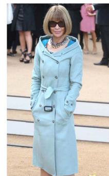
Fig. 20. Pale blue trench coat.