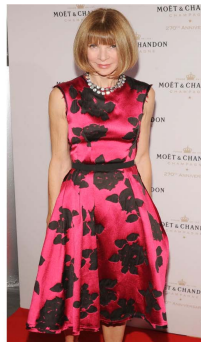
Fig. 8. Princess silhouette dress. Lanvin 2013.