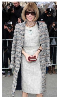
Fig. 31. Tweed long jacket with textured dress.