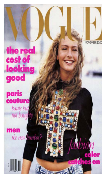
Fig. 2. 1988 Vogue USA Cover.