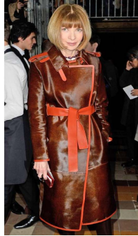
Fig. 13. Straight silhouette coat.