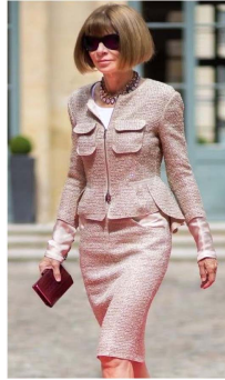
Fig. 12. Hour-glass silhouette suits.