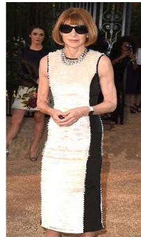
Fig. 24. Shining white dress.