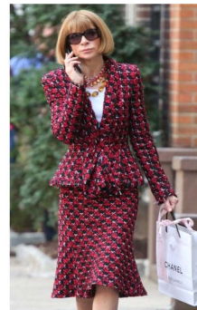
Fig. 10. Hour-glass silhouette suits. Oscar de la Renta 2013 FW.