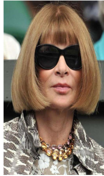
Fig. 38. Wimbledon 2014.