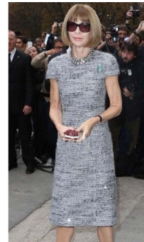
Fig. 25. Grey tone dress.

지를 전달한다. Fig. 25의 원피스 드레스는 전체적으로 여러 톤의 그레이 컬러 안(yarn)이 어우러져 N7 톤의 무채색 컬러를 이루고 있다. Anna Wintour는 특히 블랙을 그다지 좋아하지 않는 것으로 알려져 있는데, Youtube Vogue 채널의 ‘73 Questions with Anna Wintour’에서 그녀는 절대 입지 않는 패션에 대해 묻자 “Head-to-toe black”이라고 답했다(Cooper, 2014). 이러한 인터뷰를 뒷받침하듯이 All Black의 의상은 찾아볼 수 없었다. 블랙 의상을 착용할 경우, 다른 색상으로 된 아이템을 함께 매치하거나 무너로 다른 색을 배치하여 다채롭게 연출하고 있었다.