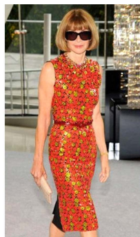
Fig. 17. Vivid yellow red dress. www.nydailynews.com