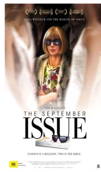
Fig. 4. Poster of documentary film ‘The september issue.’