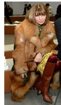
Fig. 34. Wild fur coat.