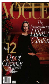
Fig. 3. 1998 Vogue USA Cover.