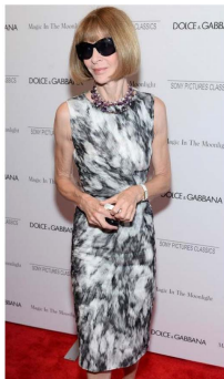
Fig. 6. Slim silhouette dress. forums.thefashionspot.com

이처럼 Anna Wintour는 아이템의 선택과 착장을 통해 스타일의 차이를 두고 다채로운 실루엣을 연출하고 있었다. 원피스 단일 아이템을 사용하여 슬림 실루엣, 프린세스 실루엣을 드러내거나 고급스럽고 포멀한 투피스, 스리피스 의상을 통해 아워