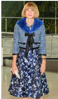
Fig. 21. Strong blue jacket and purple blue dress.