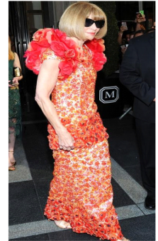
Fig. 30. Handcraft flower detailed chanel dress.