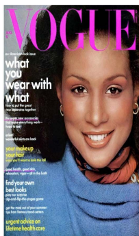
Fig. 1. 1974 Vogue USA first black cover girl.