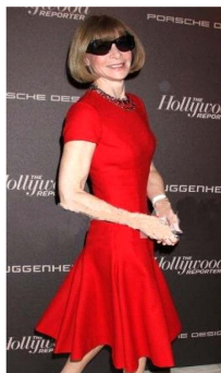
Fig. 16. Strong red dress. www.hollywoodreporter.com

셋째, 다양한 톤의 무채색을 사용하고 있었다. 이미지 자료의 약 21%가 무채색이었는데, 대표적인 예로 Fig. 24의 원피스 드레스는 광택 있는 화이트 컬러 N1톤의 의상의 가장 넓은 면적을 차지하는 동시에 프린세스 라인을 따라 사이드 면에 블랙컬러가 블로킹 되어 날씬해 보이는 효과를 주고 모던한 이미