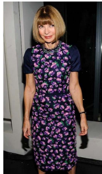
Fig. 23. Strong purple dress.