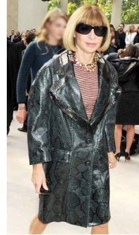
Fig. 14. Oversize silhouette coat.