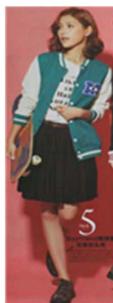
Fig. 19. 2010's Casual Style. 「Shanghai Style(上海服饰)」 (November, 2012), p. 54.