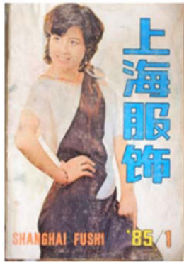
Fig. 5. 「上海服饰: Shanghai Style」 the cover page of the first issue (1985).