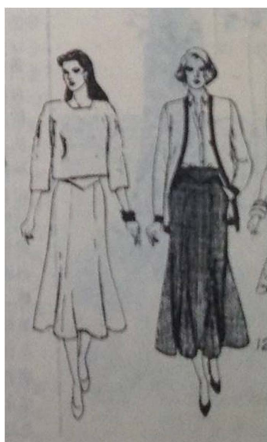
Fig. 8. 1980's Elegance Style. 「Shanghai Style(上海服飾)」(January, 1986), p. 4.

1985년부터 1989년까지 선정된 총 29장의 패션 이미지는 엘레강스 17장, 로맨틱 4장, 컨트리 2장, 캐주얼 2장, 매니시 2장, 섹시 1장, 레트로 1장으로 분류되었다. 엘레강스 스타일은 주로 길이가 무릎까지인 니트 원피스와 재킷의 조합으로 연출되었으며 전반적으로 H실루엣으로 나타났다. 봄/여름에는 하이 웨이스트 플레어 스커트가 가장 유행하였으며 심플한 상의와 함께 착용되었다. 여성의 자연스러운 몸을 그대로 표현하는 실루엣이 강하게 나타났으며 어깨나 허리를 과도하게 강조하지 않고 자연스러운 H라인과 A라인으로 표현되었다. 색상은 네이비, 베이지 등 베이직한 색상을 바탕으로 화이트와 핑크색으로 여성스런 분위기를 연출하였다. 단색이 많이 나타났지만 소재에 어울리는 꽃무늬 프린트, 스트라이프 패턴, 큰 단독 패턴을 포인트로 사용하는 경우도 있었다. 로맨틱 스타일의 연출은 주로 색상과 소재에서 다른 스타일과 구분된다. 자연 속에서 볼 수 있는 사랑스러운 색상과 핑크와 같은 캔디 색 계열로 주로 표현되었으며 레이스, 실크 등을 A라인 스커트나 원피스에 포