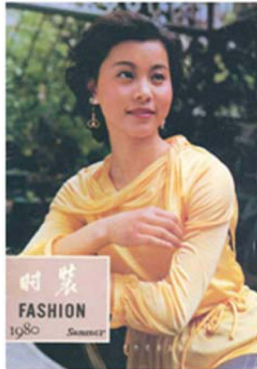
Fig. 4. 「时装: Fashion」 the cover page of the first issue (1980).