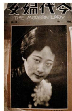
Fig. 3. 「The modern lady: 今代婦女」 the cover page of the first issue (1928).