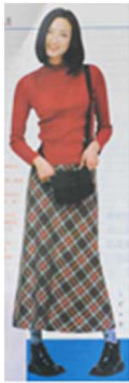
Fig. 10. 1990's Elegance Style. 「Shanghai Style(上海服飾)」 (February, 1990), p. 38.