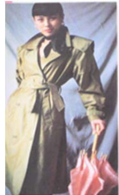
Fig. 13. 1990's Manish Style. 「Shanghai Style(上海服飾)」 (March, 1998), p. 44.