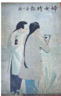
Fig. 1. 「今代婦女」 the cover page of the first issue (1911).