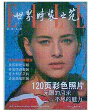
Fig. 7. 「Elle」 Chine, the cover page of the first issue (1988).

패션 섹션을 신설하여 패션정보를 적극적으로 게재하였다. 이는 1950년대에 정치적으로 발행한 정당 간행물 열풍 이후 중국에서 나타난 두 번째 간행물 열풍이라고 볼 수 있다. 이 잡지들은 해외 유행을 소개하는데 중요한 역할을 했으며 특히, 이 시기에 복식 전문가들이 정치적 사상의 굴레에서 벗어났다는 데에 중요한 의미가 있으며 패션잡지 발전의 초석이 되었다 (Zhao, 2010).