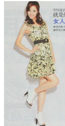
Fig. 20. 2010's Elegancel Style. 「Shanghai Style(上海服饰)」 (July, 2010), p. 36.