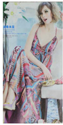
Fig. 17. 2000's Ethnic Style. 「Shanghai Style(上海服飾)」 (September, 2004), p. 58.