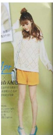
Fig. 18. 2010's Romantic Style. 「Shanghai Style(上海服饰)」 (March, 2013), p. 66.

2000년대 세계 유행 트렌드를 보면 히피스타일이 꾸준히 인기를 얻으며, 에스닉 스타일은 아시아, 아프리카를 포함한 다양한 지역에서 영감을 받아 표현되었다. 1990년대에 유행하였던 미니멀리즘 스타일은 꾸준히 나타났고 실용적 스타일이 주목을 받으면서 트레이닝웨어와 아우도어 룩이 유행하면서 다양한 운