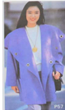
Fig. 12. 1990's Casual Style. 「Shanghai Style(上海服飾)」 (January, 1996), p. 39.