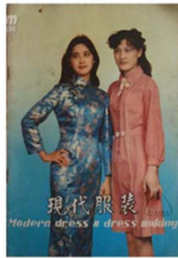
Fig. 6. 「现代服饰: Modern dress and dress making」 the cover page of the first issue (1981).