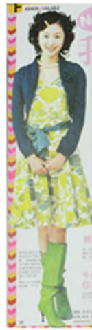
Fig. 15. 2000's Romantic Style. 「Shanghai Style(上海服飾)」 (December, 2000), p. 30.