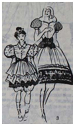
Fig. 9. 1980's Romantic Style. 「Shanghai Style(上海服飾)」(January, 1986), p. 5.