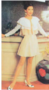
Fig. 11. 1990's Romantic Style. 「Shanghai Style(上海服飾)」 (March, 1994), p. 26.