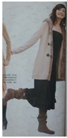
Fig. 16. 2000's Casual Style. 「Shanghai Style(上海服飾)」 (January, 2004), p. 60.